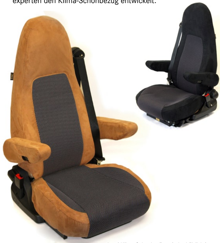
Aguti Klima-Schonbezüge sind erhältlich in sand/grau und anthrazit/grau

Aufgrund seiner hervorragenden Eigenschaften wird 3D-Gewirke nicht nur im medizinischen Bereich und bei modernen Matratzen, sondern auch in Oberklasse-Fahrzeugen und bei Luxusyachten verwendet.